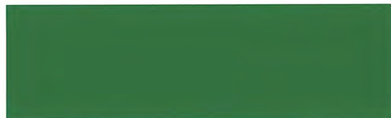
Verde / green / vert / verde